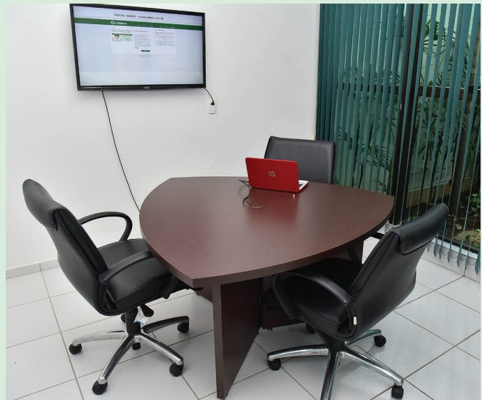
1ª CCM-CRCF é sediada na ASBAN.

E m novembro, a ASBAN visitou representantes dos Bancos Santander, Bradesco e Caixa Econômica Federal (CEF) para discutir a parceria entre as instituições, já em fase de finalização, para utilização da 1ª Câma-