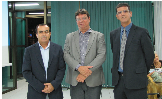
Convidados conheceram a Câmara de Conciliação e Mediação, Centro de Resolução de Conflitos Financeiros da Asban