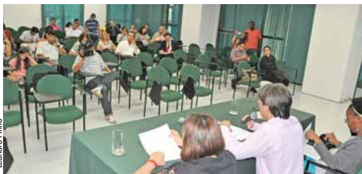
Evento reuniu representantes do segmento educativo.

O ciclo de Debates Goiás Século XXI, promoveu no dia 30, quarta-feira, no auditório da Associação de Bancos nos Estados de GO/TO/MA - ASBAN, debate sobre a “EDUCAÇÃO, UM DIREITO DE TODOS”, objetivando discutir o Plano Nacional de Educação-PNE, que vai orientar as políticas educacionais para os próximos 10 anos.